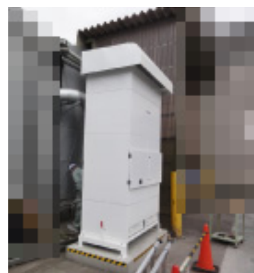
集塵機設置と配管