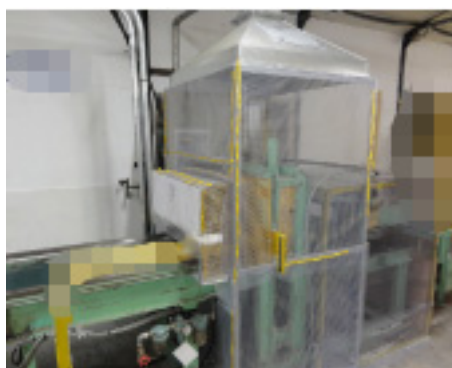
粉じん発生工程の囲い込み